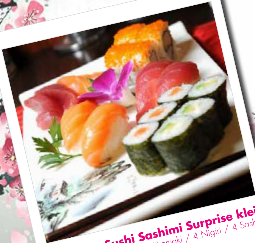
Nr. 352. Sushi Sashimi Surprise klein 6 Maki / 4 Uramaki / 4 Nigiri / 4 Sashimi