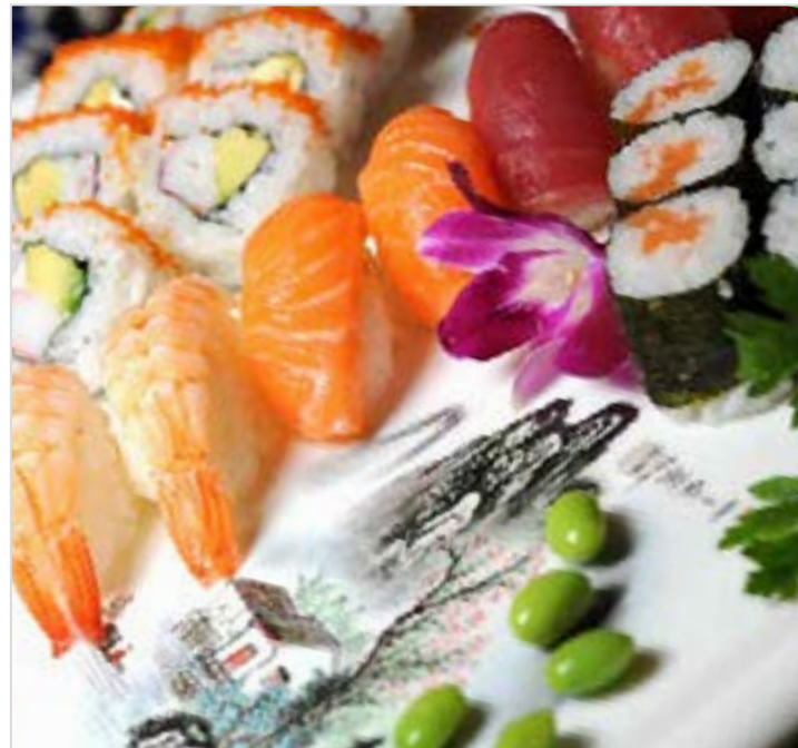
Nr. 353. Sushi Sashimi Surprise gross 6 Maki / 8 Uramaki / 6 Nigiri / 6 Sashimi