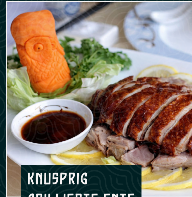
KNUSPRIG GRILLIERTE ENTE