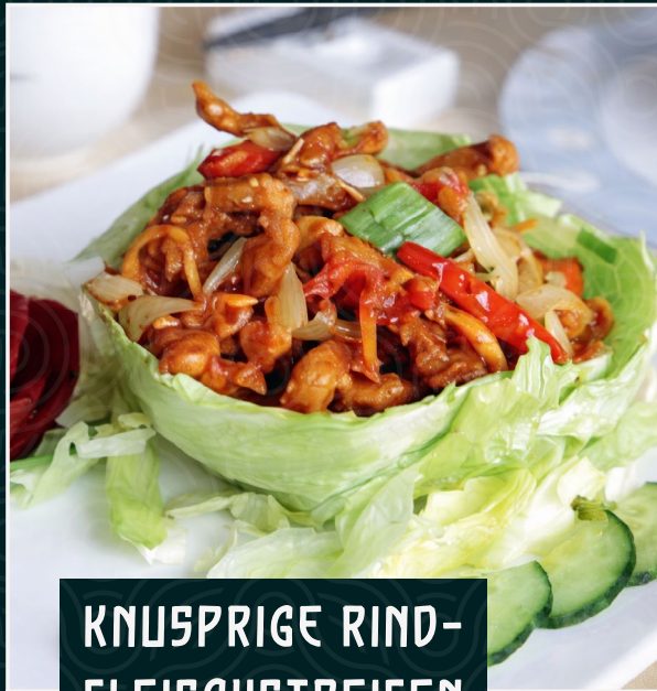
KNUSPRIGE RIND- FLEISCHSTREIFEN

Gedämpfter Reis CHF 2.00 / Gebratener Reis CHF 3.50 / Gebratene Nudeln CHF 3.50